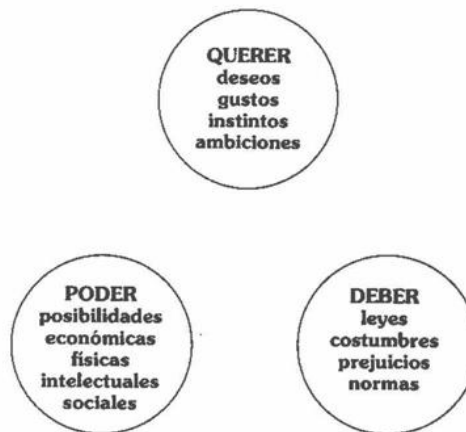
Figura 1. Juego de Esferas, QUERER PODER Y DEBER

Por ejemplo: (los personajes mencionados y las situaciones referidas corresponden a la radionovela Vamos a la Fija)