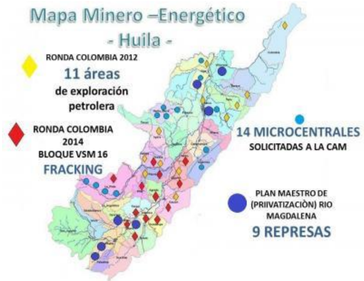
Figura 1.1. Mapa minero-energético del departamento del Huila