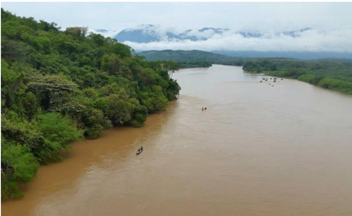
Panorámica del río Magdalena en Natagaima

La cuenca proporciona el cincuenta por ciento de la pesca continental, de la cual dependen cuarenta y cinco mil familias, produce el 80% del producto interno bruto en Colombia y genera el 75% de la producción agropecuaria, ha documentado The Nature Conservancy .