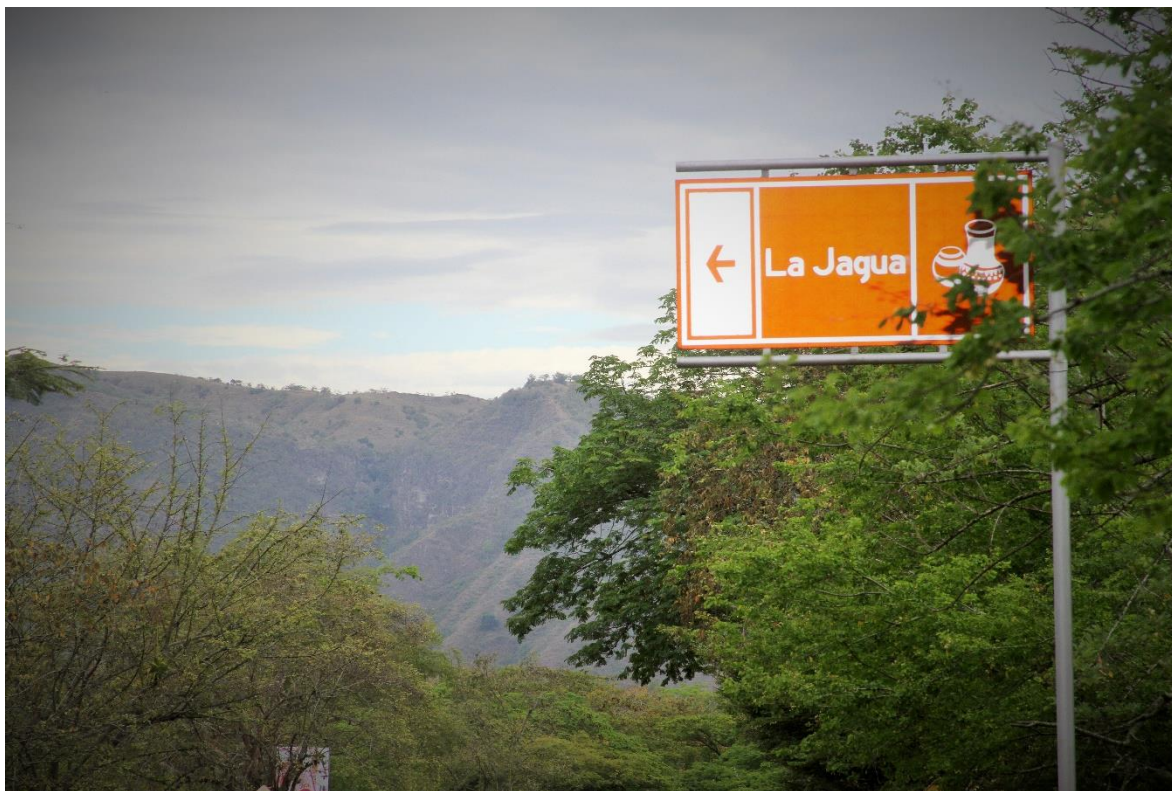
La Jagua, Huila