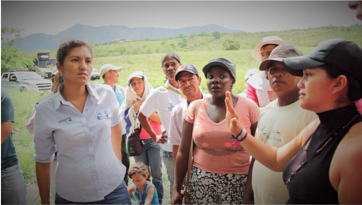
Photo: an attempt to plunder, La Jagua-Huila, November 21 st , 2014, Jaguos on the land

The Jagueña woman is characterized as feisty and creative, the land and river are elements that unite all, the love for their jobs, working each day for wages from cultivating crops like rice, cotton, lemon, tomatoes, beans, meadows, cocoa beans and banana or cassava, along with bamboo and palm trees.