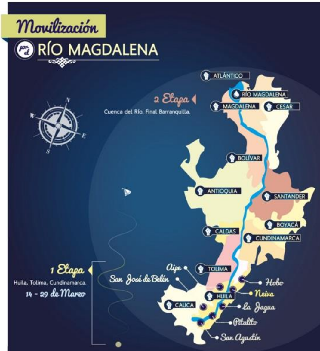
Figura 3.2. Tramo de la Movilización por la Defensa del Río Magdalena

Diseño: César Andrés Rodríguez.