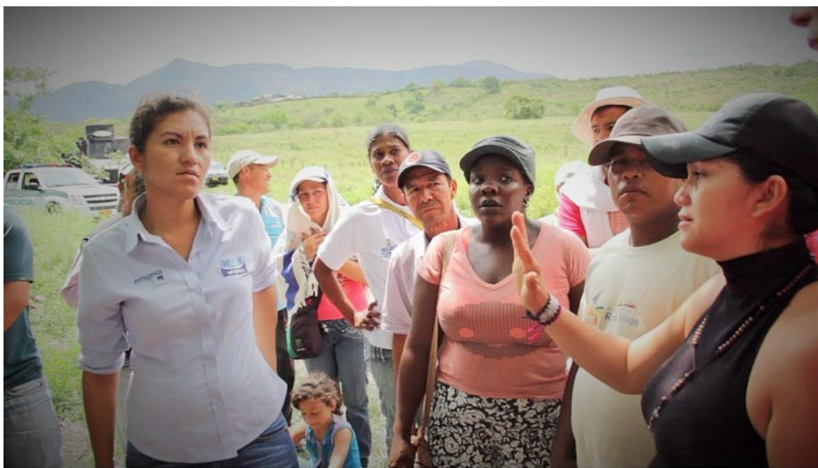
Intento de desalojo, La Jagua -Huila, noviembre 21 de 2014.

La mujer Jagueña se caracteriza por ser luchadora y creativa la tierra y el río son elementos que las une a todas, el amor por el jornal, trabajando al día por un salario en cultivos de arroz, algodón, limón, sembríos de tomate, habichuela, frijol y vegas cacaoteras plataneras o yuqueras, además de la guadua y el pindo.