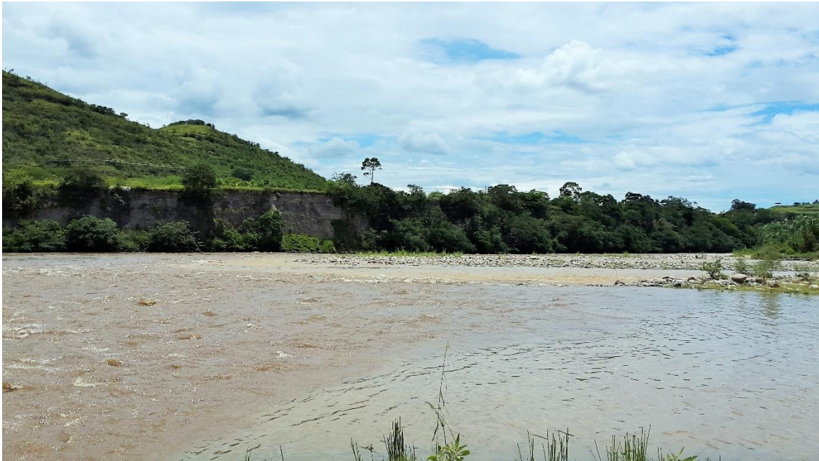
Las Juntas, unión del río Suaza con el Magdalena.