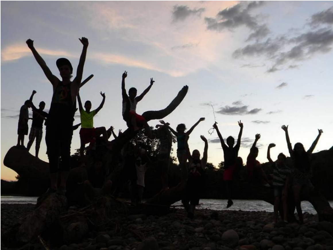
Photograph: People from the Jagua community on their land

Where are the rights of those that live on the coast? When the rulers and leaders of this country make decisions behind people's back and failing to meet the necessities and the interests of citizens, the defence of nature and the protection of water are the only things that secure and guarantee a future, not simply for a few people but for all of humanity - we are in a time where the powers that prevail on this planet not only endanger job security and living spaces of some communities but are endangering the whole world and possibility lasting life.