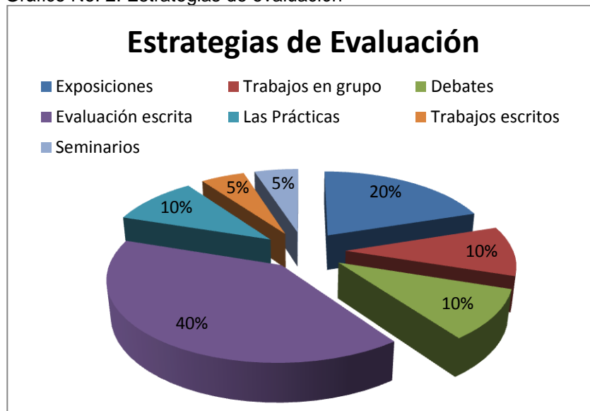
Gráfico No. 2: Estrategias de evaluación

Como se puede apreciar en el gráfico anterior, gran parte de los docentes entrevistados realizan la evaluación escrita como una de las estrategias para evaluar a sus estudiantes. No obstante, también señalaron que llevan a cabo exposiciones, debates, seminarios, prácticas (de laboratorio, extramuros,