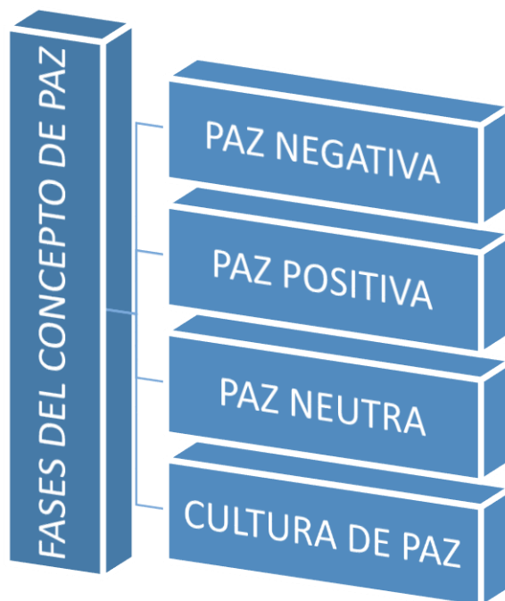
Figura 1. Fases del concepto de paz.

Los estudios de paz han pasado también por distintas fases de desarrollo pasando desde la funcionalidad, expansión – especialización – fragmentación, hasta la hibridación; estos estudios pueden explicarse desde diferentes etapas que tratan de formar un concepto estructurado de paz, sin embargo, estos intentos de dar el concepto final de paz han terminado sesgándose e inclinándose por una característica específica. Como lo señala Jimenez (2011), se dan diferentes etapas en el transcurso de la evolución del concepto: