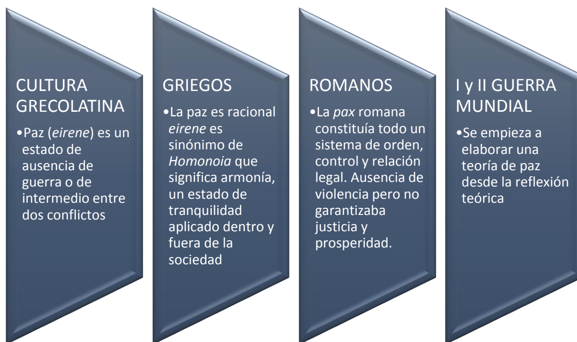
Figura 2. Concepto de paz en diferentes culturas.

Para Galtung que fue el autor de la Teoría de los conflictos se pueden observar tendencias marcadas en esta teoría: una enfocada al desarrollo del militarismo y armamentismo nacional como forma de defensa frente al exterior y otra desde el sentido de paz dominante definida desde el Estado con todo su aparato político. En el transcurso de la historia se pueden ver diferentes formas de ver la paz desde occidente algunas ligadas a la guerra: