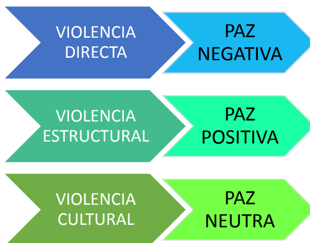
Figura 3. Relación de la violencia y la paz

Con Galtung aparecen tres conceptos de violencia (directa, estructural y simbólica) y cada una de las paces que se presentan a lo largo de la historia busca explicar o dar solución a una de esas violencias, o se encuentra relacionada con ella: