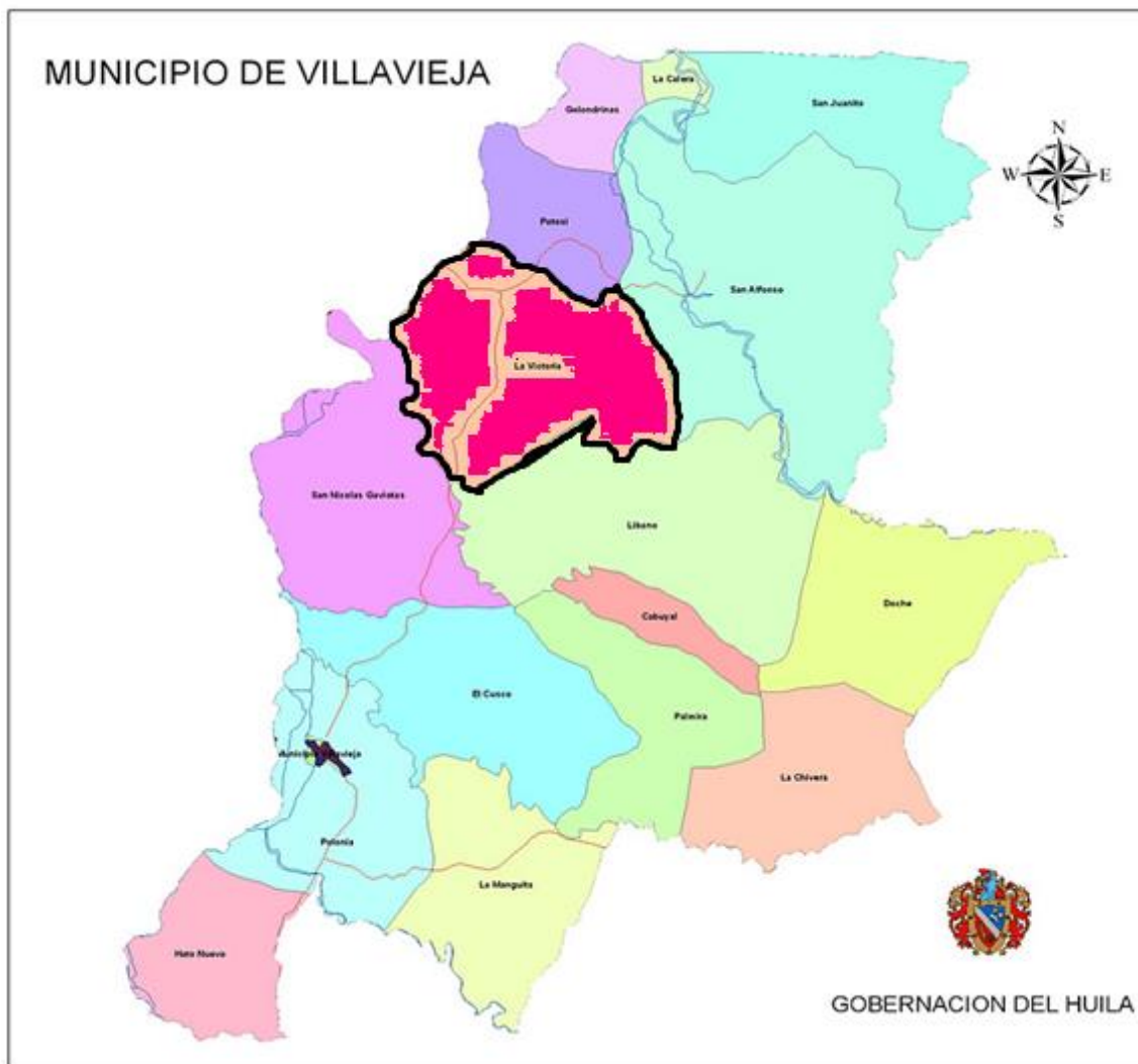
Figura 1. Ubicación de la vereda La victoria en el municipio de Villavieja