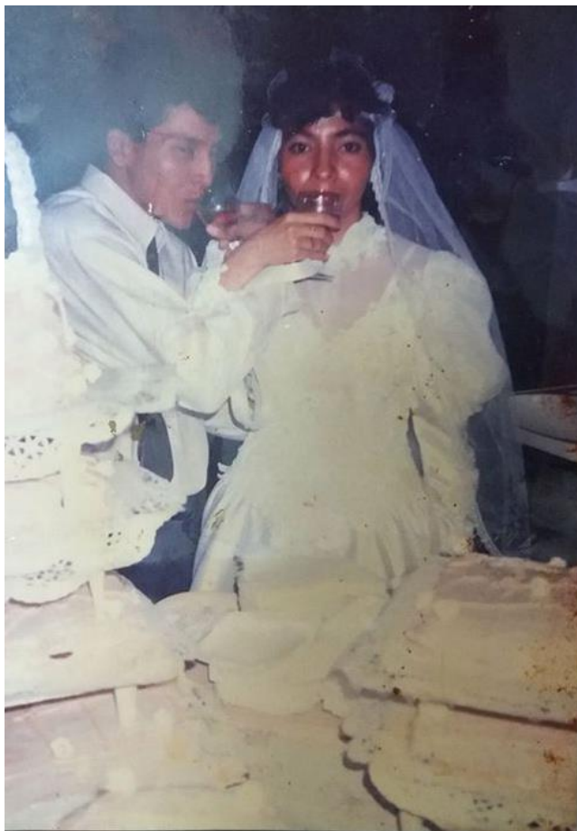
Figura 3. Boda en la fiesta patronal de La Virgen del Carmen en La Victoria Villavieja.

Para las celebraciones religiosas se les