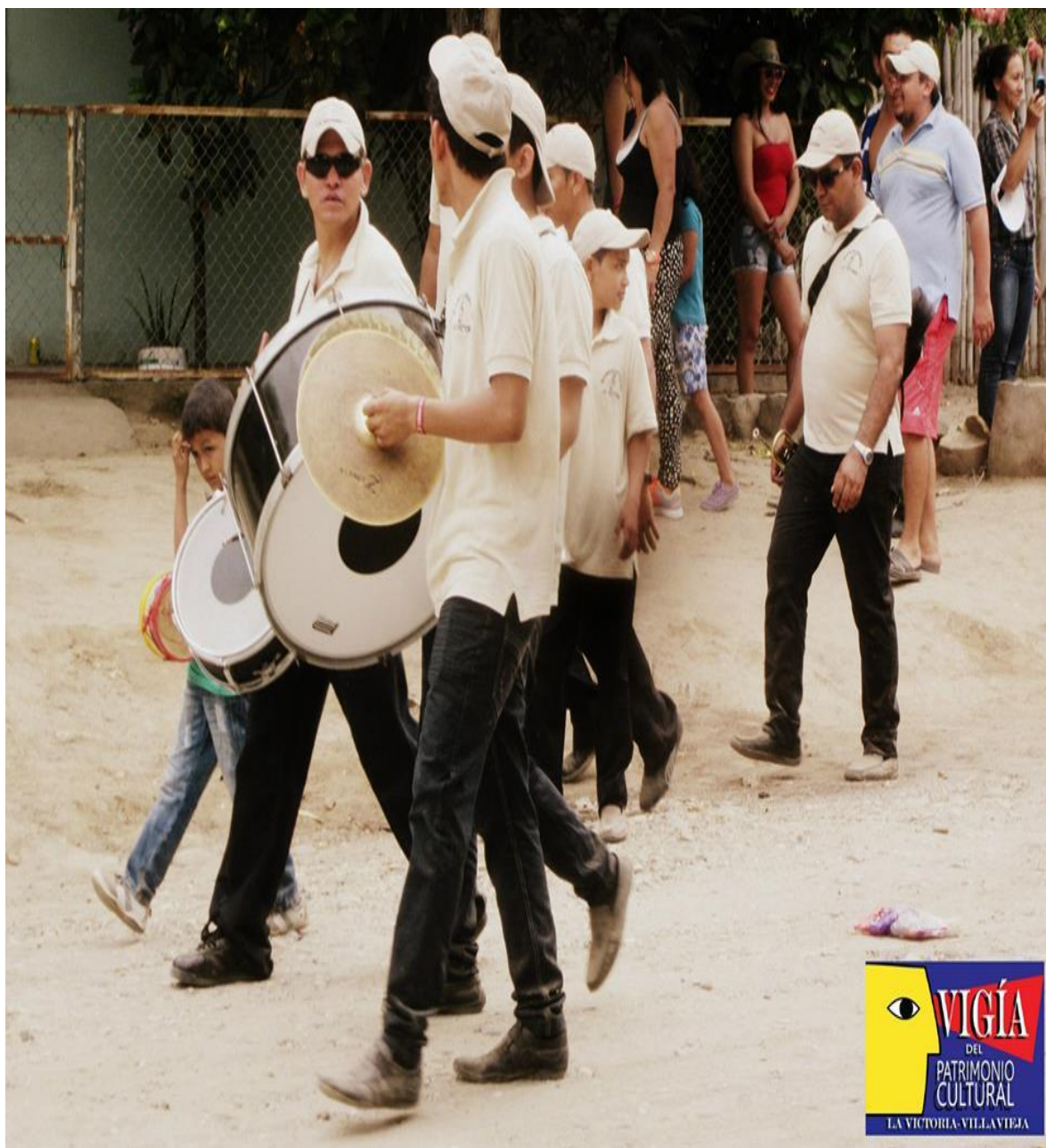
Figura 13. Banda musical de La Victoria en la fiesta patronal en Honor a la Virgen del Carmen.