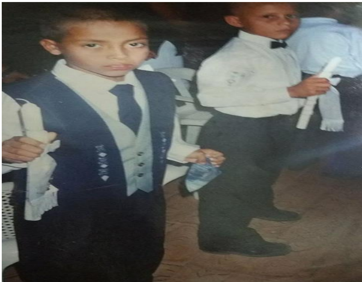
Figura 2. Sacramento religioso en la fiesta patronal de La Virgen del Carmen en La Victoria Villavieja.

lección los unos a los otros, hablan de cómo será su traje de primera comunión, las niñas cuentan quién las peinará, quienes vendrán a su fiesta, incluso los que ya la han cumplido con el sacramento católico lo recuerdan con mucho cariño, por esos días las risas de alegría y nervios son frecuentes, porque cuando llegue el padre ha a tomar la lección esperan pasar el examen, que es hecho de forma oral, todos se dan cuenta de la forma como contestan, si algún niño dudan, o se queda en silencio o lo acompaña los nervios, algunos padres de familia además de estudiar con los niños en casa para que aprueben el examen, también hablan con los profesores del