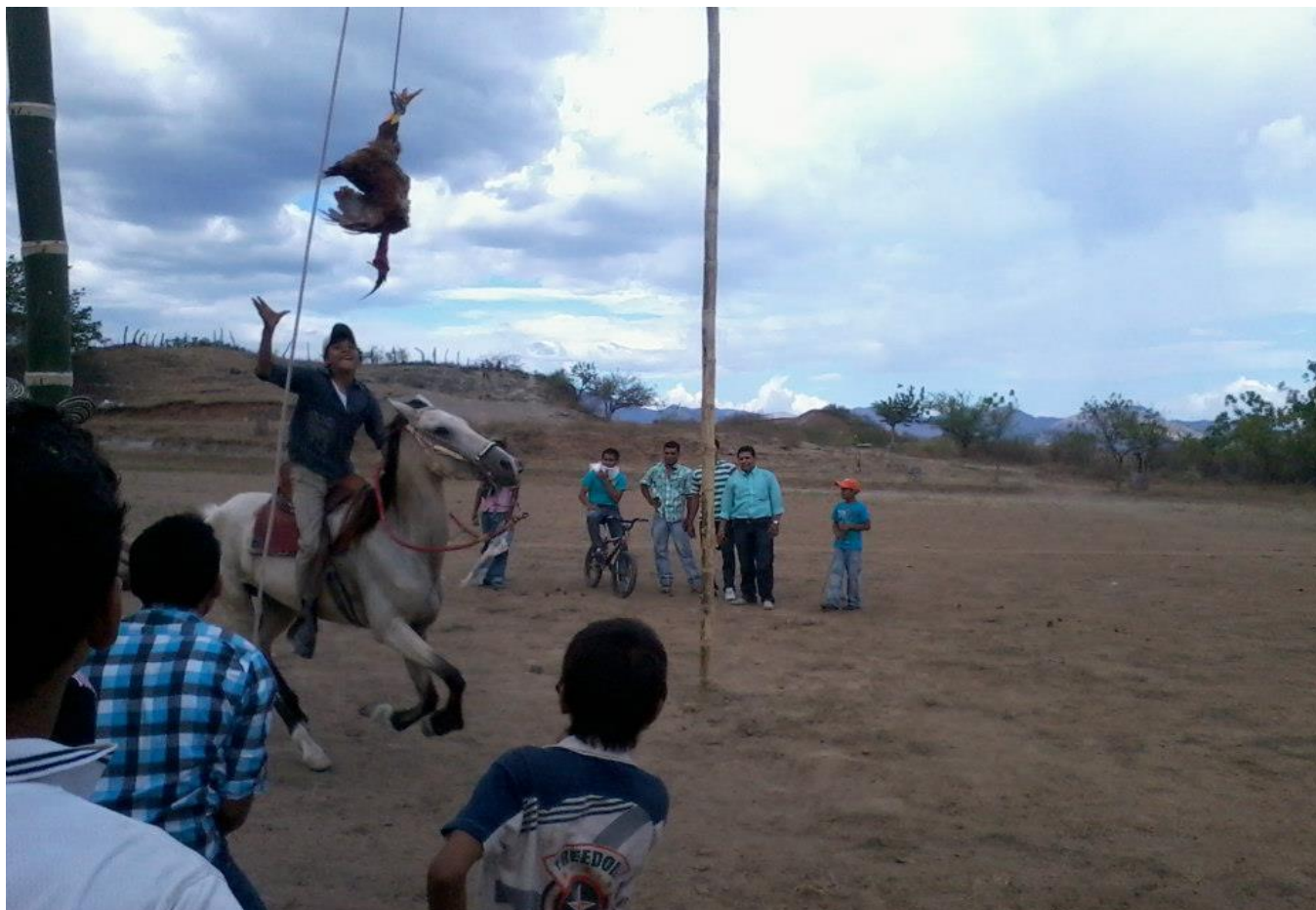
Figura 4. Concurso descabezadura de gallo. Fiesta patronal de la Virgen de Carmen en La Victoria, Villavieja.