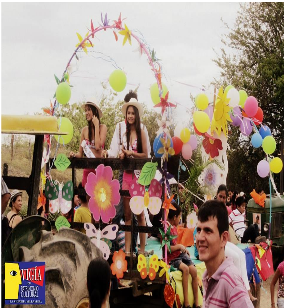
Figura 12. Desfile de reinas en la Fiesta patronal en Honor a la Virgen del Carmen