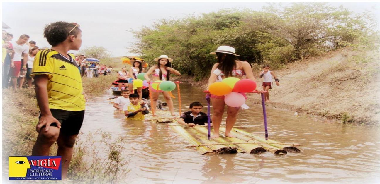
Figura 5. Agosto del 2014. Fiesta Patronal de La Virgen del Carmen. La Victoria, Villavieja.

La fiesta en honor a la Virgen del Carmen ha tenido varios cambios con el transcurrir del tiempo. Desde hace aproximadamente tres años se ha agregado dos prácticas en la programación. Una de ellas es el reinado popular, aunque ya lleva tres versiones, en el 2015 no se celebró, participan señoritas de la misma vereda, representando al comercio y zonas del centro pablado, también se invitan a que participen candidatas de los mirantes y veredas cercanas Potosí y San Alfonso. Bailan el San Juanero en el polideportivo, realizan un desfile de carrozas por las calles principales de La Victoria. Hay un desfile acuático, se diseña una barca con también hacen barcas con el tallo del plátano