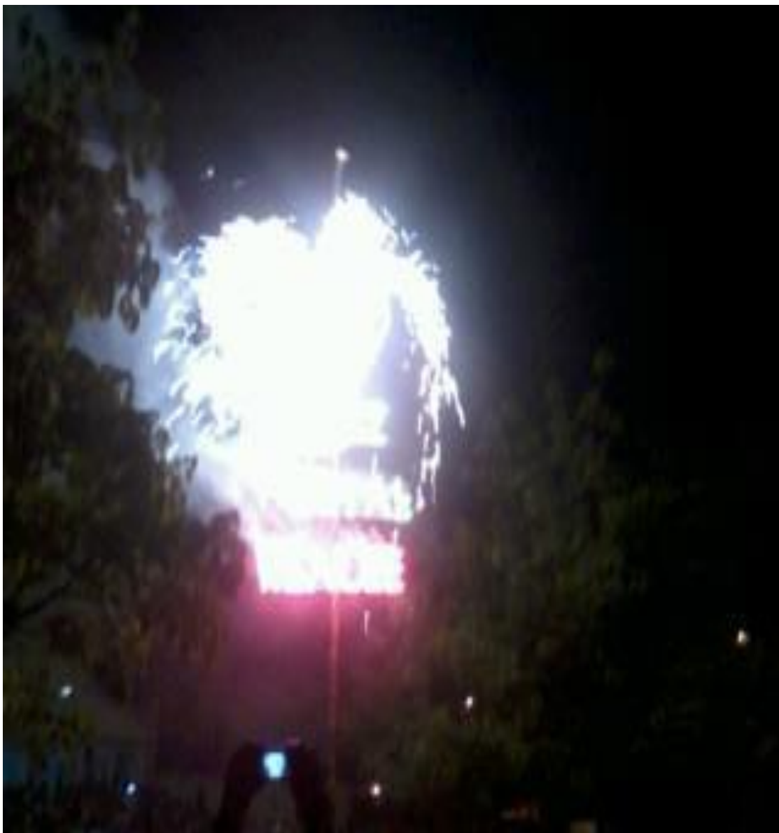
Figura 11. Quema del Castillo. Fiesta patronal en Honor a la Virgen del Carmen