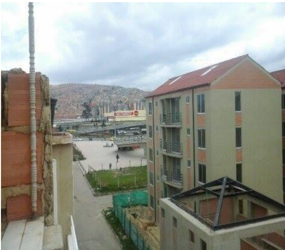
Figura 8. Barrio, San Mateo en Bosa, Bogotá. en varias de estas casas viven los migrantes de La Victoria, Villavieja. han construido su propio territorio, la mayoría son vecinos, para poderse colaborar entre ellos.