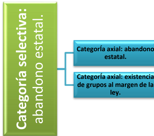
Figura 2. Abandono estatal.

de transporte precarias que imposibilitan sacar los productos que cultivan a los lugares de acopio y servicios públicos adecuados.