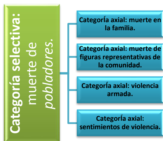
Figura 2. Categoría Selectiva: Muerte de Pobladores.