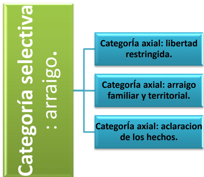
Figura 3. Arraigo.