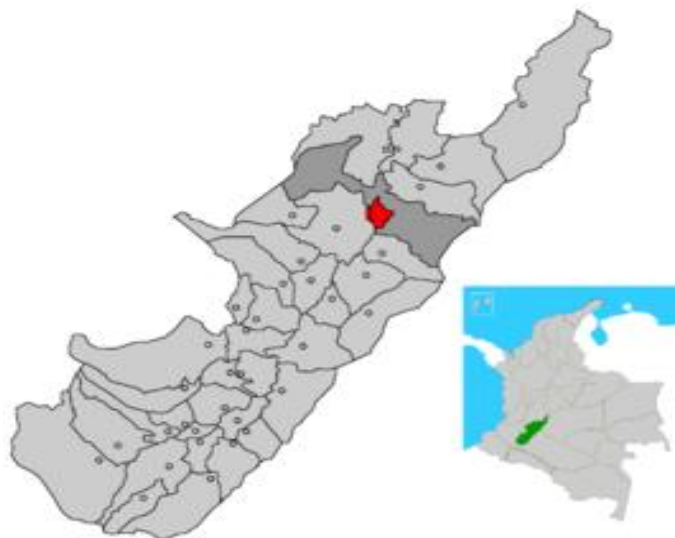
Ubicación del departamento del Huila en Colombia.