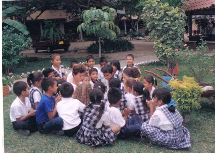
Fotografía 1. Taller Martes de Poesía, en sus inicios. Fase de sensibilización . Hobo, 2004.