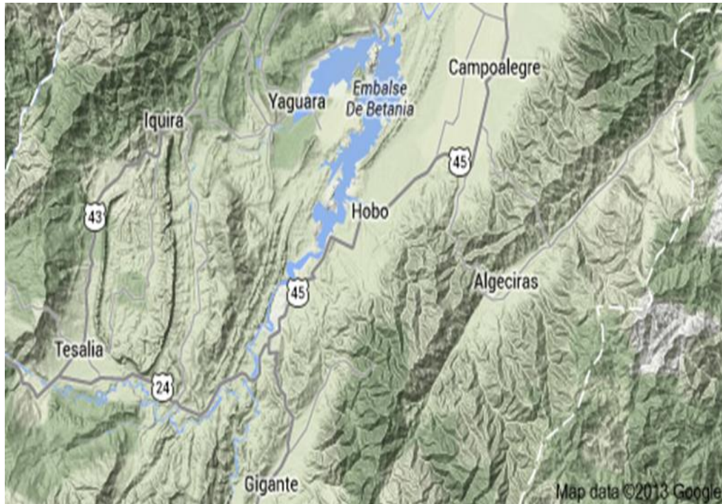
Mapa 1. Topografía del municipio de Hobo.

Pero también, durante este período, ocurrieron conflictos internos relacionados con la tenencia de la tierra, la hegemonía política, la falta de apoyo al campesinado y la presencia de la guerrilla y el narcotráfico 13 .