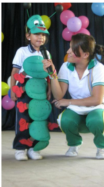
Fotografía 6. Los jóvenes desarrollan su Servicio Social Estudiantil en Martes de Poesía, con los niños de los Hogares Comunitarios de la zona urbana del Municipio de Hobo.