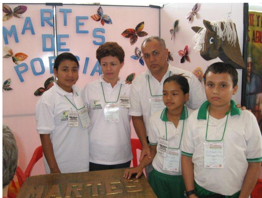
Fotografía 4. Participación de Martes de Poesía en el Encuentro Departamental de Experiencias Pedagógicas Significativas.