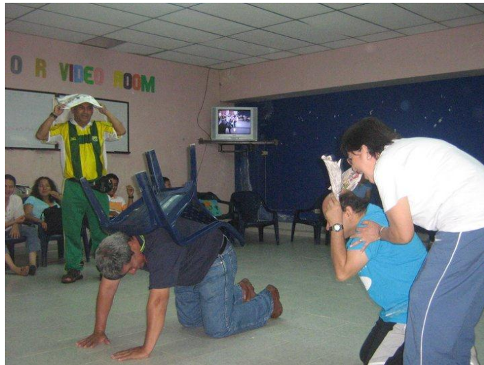
Fotografía 2. "Sentir la poesía con el cuerpo". Taller con los docentes del municipio del Hobo.