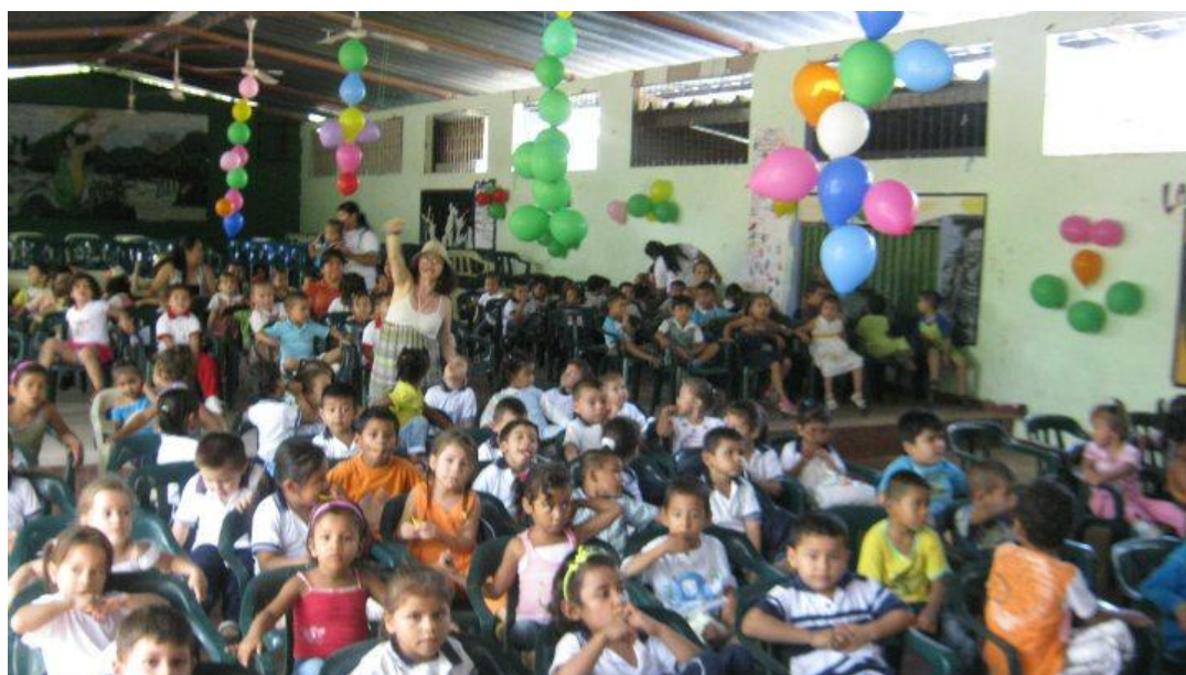
Fotografía 7. Festival “Semillas de poesía con los Hogares Comunitarios”; clausura del Servicio Social Martes de Poesía.