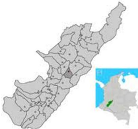
Mapa 2. Ubicación del Hobo en el departamento del Huila.

En 1985, con la Represa de Betania, llegaron personas de otras regiones y esperanzas de nuevos y más productivos renglones en la economía del municipio 14 , así como la inundación de un alto porcentaje de tierras fértiles y los consecuentes cambios en los ecosistemas de esa parte del río Magdalena 15 y de las labores de quienes trabajaban en las mencionadas tierras.