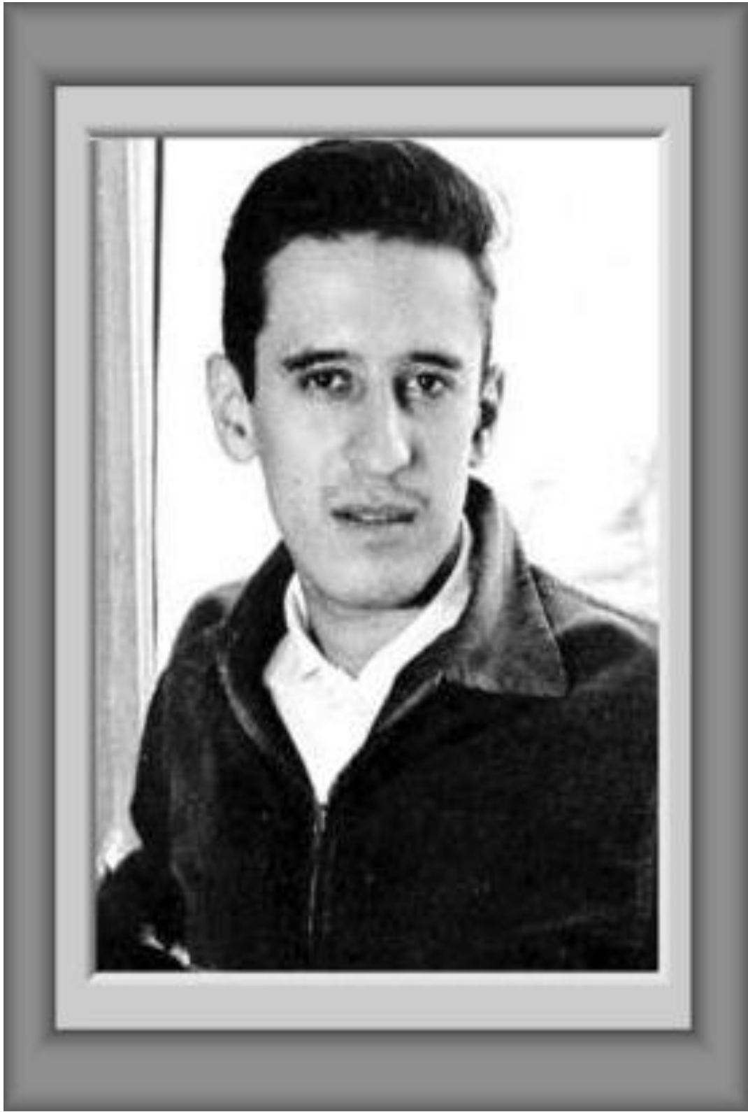
Roque Dalton 1956