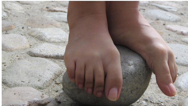
Cuadro 12. Ficha de la imagen 6