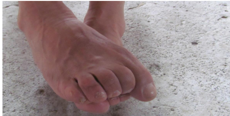
Cuadro 19. Ficha de la imagen 13