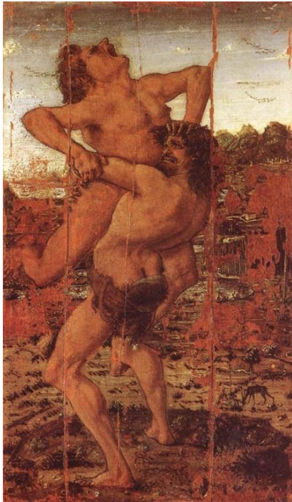
Figura 2. Imagen 2

En cuanto al arte profano en el taller de los Pollaiuolo se pinta en el último tercio del siglo XV la tabla conocida como Hércules y Anteo , (hoy desgraciadamente es la única de las tablas que el taller pintó sobre las hazañas del héroe) y muestra el momento en que Hércules va a despedazar al gigante Anteo. Lo agarra fuertemente aprisionando al adversario y todos sus músculos parecen en tensión. Vasari describe la escena en sus Vitae y dice que “es tan titánico el esfuerzo que se siente en sus dientes y que en el momento culminante los dedos de los pies se hinchan”, esto se ajusta a la imagen en la que los pies parecen sujetarse al suelo por el esfuerzo, indicando el interés naciente en esos años por los estudios de anatomía (pintores y escultores estudian la materia, siendo desde entonces su representación mucho más descriptiva, detallista y con cierto sentido del modelado).