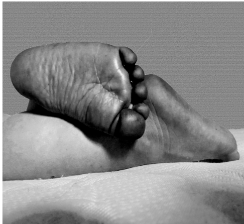
Cuadro 21. Ficha de la imagen 15