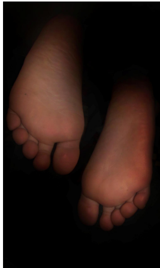
Cuadro 13. Ficha de imagen 7