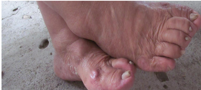
Cuadro 18. Ficha de la imagen 12