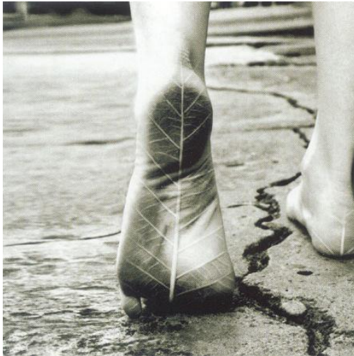
Foto 6. Paraiso, Adrarve, Ana. Impresión digital 40x40cms, 2003, visual, urbano

Los pies en movimiento, y el tratamiento en la imagen, utilizan los pies y los elementos de la tierra como la tierra quebradiza, el agua y relaciona la vida vegetal. Esta imagen al igual muchas otras, puede mostrar el interés por los sucesos en la sociedad. Esta imagen produce emociones y análisis crítico a un tema social.