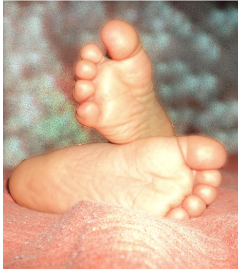
Cuadro 20. Ficha de la imagen 14