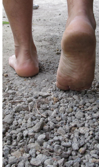
Cuadro 17. Ficha de la imagen 11