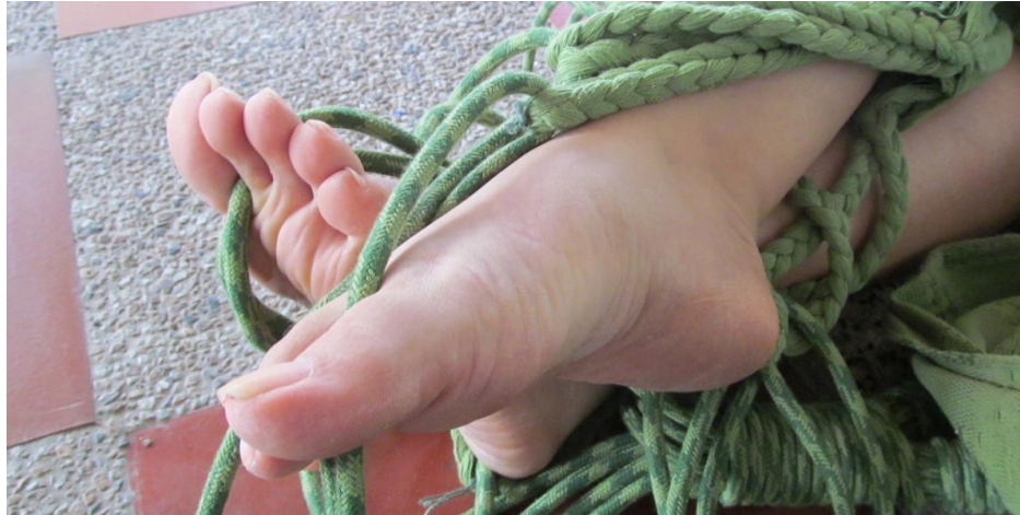
Cuadro 10. Ficha de la imagen 4