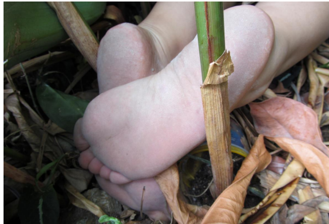
Cuadro 11. Ficha de la imagen 5