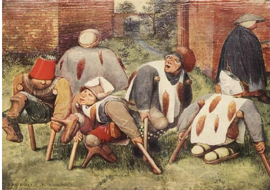
Figura 3. Imagen 3

De forma similar en la Parábola de los ciegos guiados por otro ciego, la iconografía hace alusión a un tema bíblico: si un ciego guía a otro ciego, ambos caen en un hoyo. El dinamismo en la pieza se logra con la línea descendente que describe la trayectoria de los pies de los invidentes que empiezan a caer víctimas de su propia necesidad, ya que el vacilar de pies o tropezar equivale a flaquear de espíritu 15 .