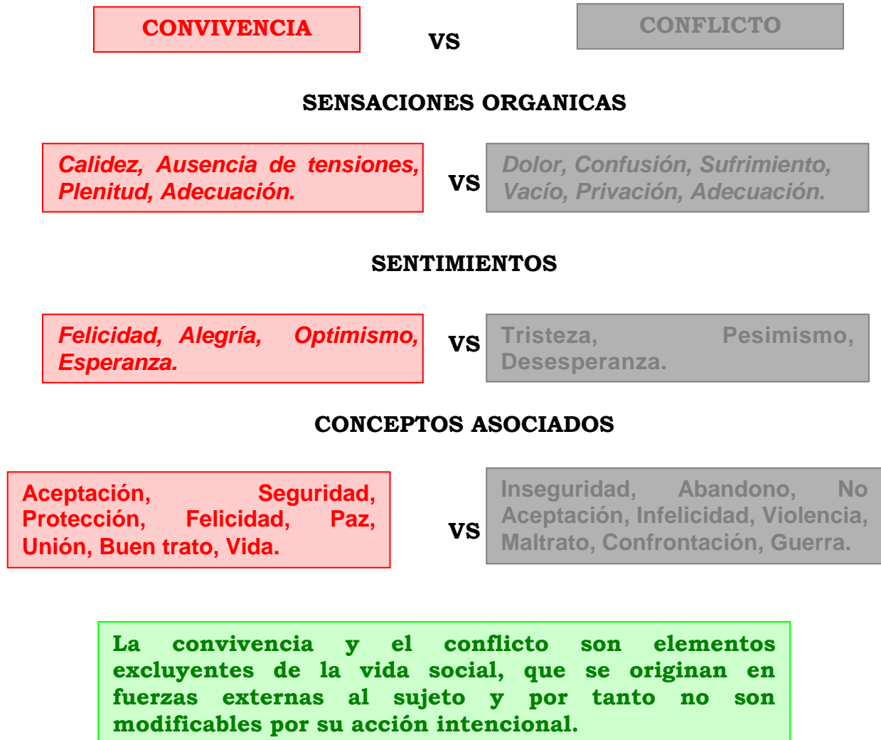
Figura 1. Convivencia y conflicto: vivencias excluyentes

Ejes percibidos como irreconciliables y por tanto vivenciados como excluyentes. Percepción y vivencia fundada en la familia, repetida en la escuela, reconocida en los espacios sociales. “La policía es convivencia porque ella es la que algunas veces soluciona los problemas como cuando hay peleas o robos y uno puede tener paz”.