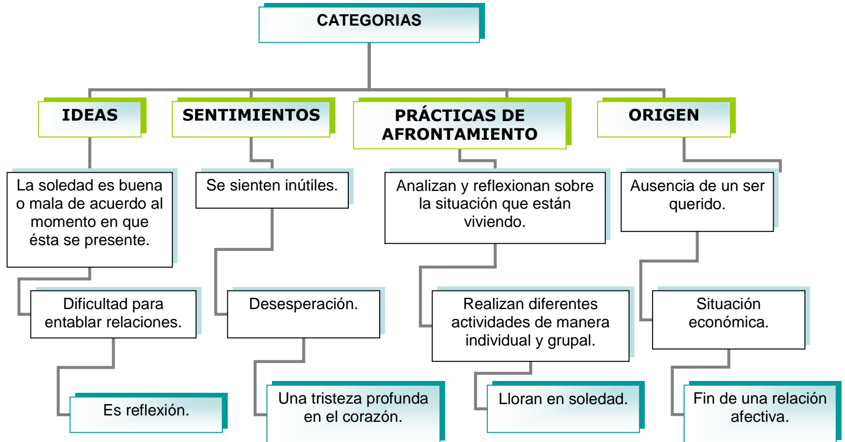
Cuadro 4. Representaciones Sociales de la Soledad En los Hombres Adultos de Neiva