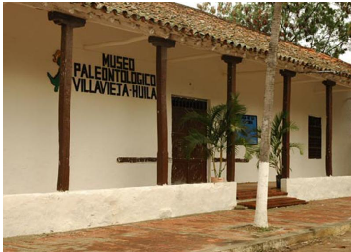
Figura 5 Museo Paleontológico

A través de tres salas de exposición así: mamíferos, reptiles y ambiente. El museo presenta una completa cronología y la síntesis de Villavieja y sus alrededores, destacando aspectos no sólo paleontológicos, sino históricos y culturales.