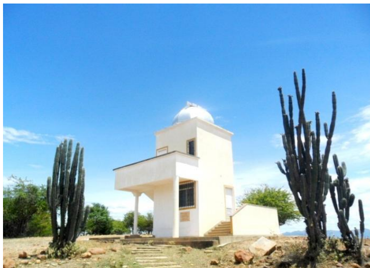
Figura 4 Observatorio Astronómico

Así mismo, el Museo Paleontológico guarda más de 950 piezas fósiles originales de la época del mioceno correspondientes a la fauna y flora que existía en la región hace más de veinte millones de años. Se encuentra una colección de pinturas, una maqueta con figuras en miniatura de los animales que ocuparon el desierto, muestras cerámicas de la cultura pijaos, una urna con el cráneo de un cura jesuita y un módulo de historia donde se exhiben tres bayonetas y una escopeta utilizadas en la guerra de los mil días (Ver figura 5).