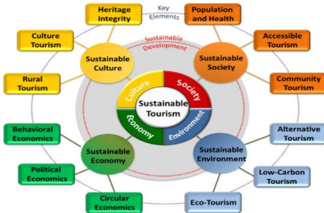
Figura 1 Aspectos conceptuales para el turismo sostenible

Fuente. Pan, Gao, Kim, Shah, Pei y Chiang (2018)