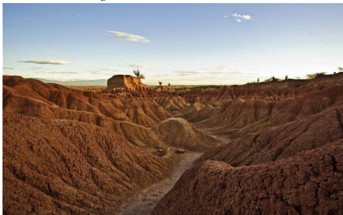
Figura 3 Desierto de La Tatacoa

La caracterización más importante del territorio de Villavieja se encuentra en el desierto de la Tatacoa, localizado entre el Río Magdalena y la Cordillera Oriental, corresponde a una zona de bosque seco tropical, muy erosionada cruzada por cañones secos labrados por las riadas violentas que se forman transitoriamente en el invierno. Esta zona desértica y de yacimiento fosilíferos tiene una extensión total de 330 kilómetros cuadrados, hallándose fósiles de moluscos, tortugas, roedores, armadillos y perezosos lo que ha llevado a plantear que la Tatacoa debió tener originalmente una flora exuberante, diversificada en especies y estratos arbóreos vegetales (Ver figura 3).