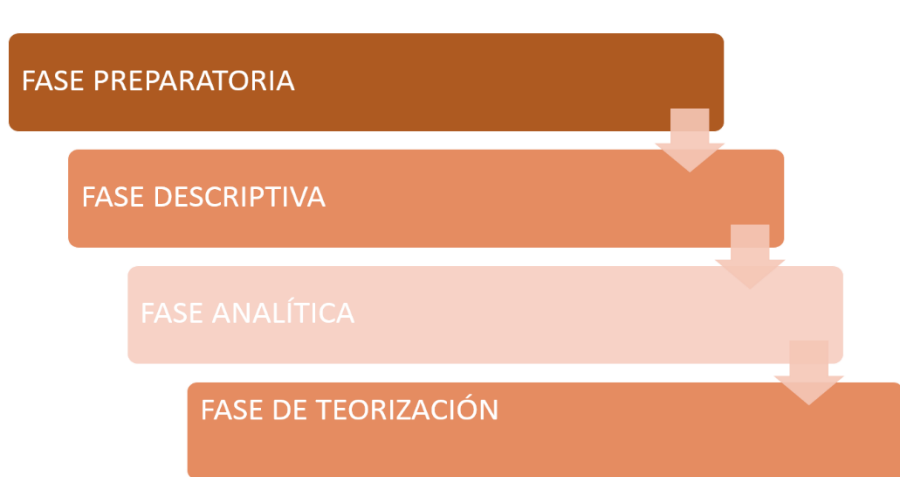
Figura 2, Fases de la investigación cualitativa (Interpretada desde el punto de vista de las investigadoras)

Existen cuatro fases para completar una investigación cualitativa, como se puede observar en la figura 2. Estas fases sostienen una forma lineal, y cuando se llega al final de una de estas fases, dejan un producto para pasar a la siguiente. De esta manera se puede observar que van de manera lineal, es decir cuándo va acabando una de estas fases se inicia la siguiente.