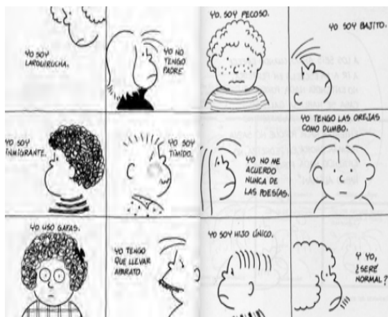
Ilustración SEQ Ilustración V* ARABIC 2 Diversidad