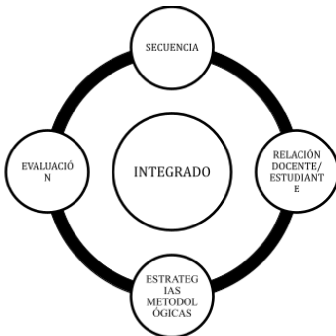
Ilustración 4 Propuesta modelo pedagógico inclusivo para universidades a nivel internacional