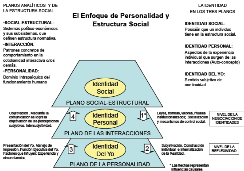
Diagrama basado en: Côté, (1996, 1997, 2002, 2005) Côté & Levine, (2002)