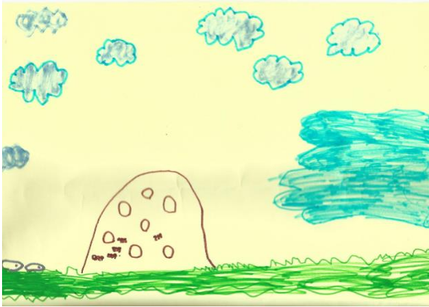
Figura 1. Dibujo Azul