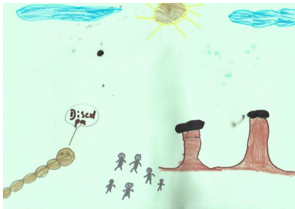
Figura 2. Dibujo Beige