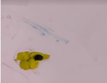
Figura 2 Dibujo de Purpura

En el desarrollo del taller se pudo evidenciar que los niños en repetidas ocasiones proponen el rescate como un hecho de memoria que merece ser reconocido y rescatado. En las creaciones elaboradas por los participantes Café, Rojo, Purpura y Blanco, se destaca el reconocimiento del rescate.