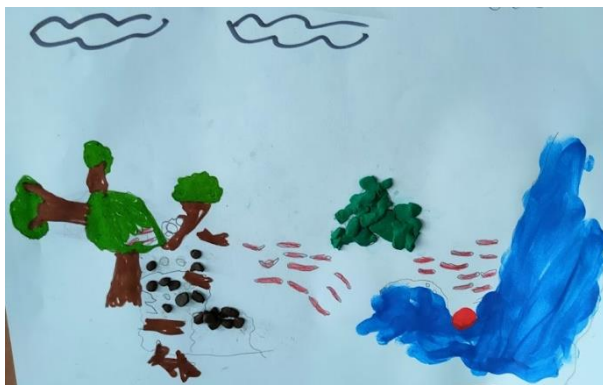
Figura 1 Dibujo de Café

En la memoria se tramita el hecho violento como un trabajo del recuerdo en el cual se preservan los restos del pasado y se resalta esta acción negativa (Jelin, 2002). También, podría ser ejemplo de la importancia que tienen los episodios violentos en la historia pasada del país, pues se reitera la forma violenta en la que actuó uno de los personajes “ Caótico ”, lo cual refleja situaciones de conflicto o peligro, que al parecer son sucesos importantes en la cotidianidad de los niños.