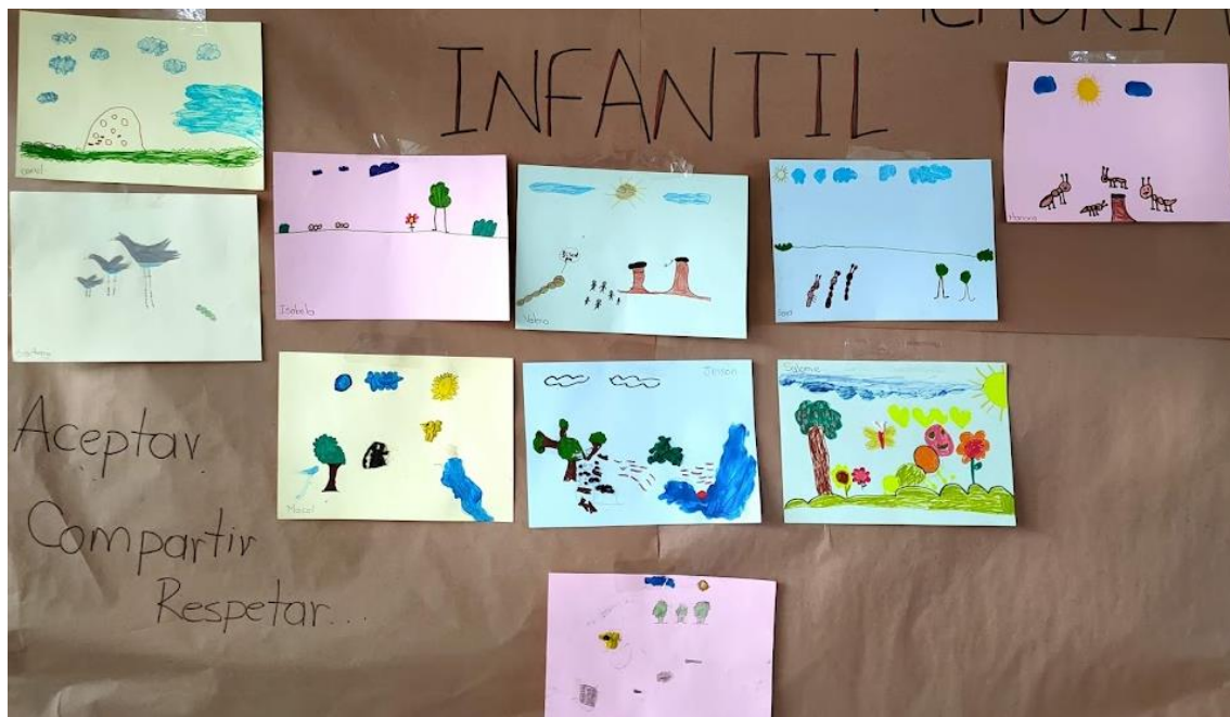
Figura 7. Recopilaciones de trabajos

Ricoeur (1999) afirmó que “no es posible deshacerse de lo que se ha hecho, ni hacer que lo que ha sucedido no suceda, el sentido de lo que ocurrió no se encuentra fijado de una vez y para siempre”, por ello el reconocimiento de cada acción resultó significativa dado que posibilitó la reinterpretación o resignificación realizada a través del reconocimiento de estas acciones de daño desde la narrativa de un cuento.