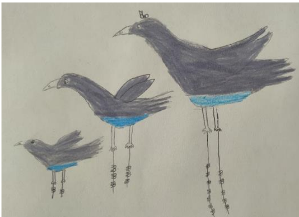
Figura 4 Dibujo de Rojo

subieron a ellas y así se fueron colgando hasta un lugar seguro. ” Un detalle curioso de la imagen es ver a la hormiga reina siendo rescatada en la cabeza del pájaro más grande.