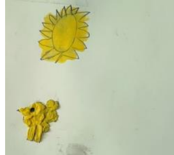
Figura 3 Dibujo de Blanco

Las ilustraciones anteriores elaboradas por Purpura (Figura 4) y Blanco (Figura 5) describen con dibujos el ataque al hormiguero por parte de Caótico y sus cómplices, pero también integran a un gran pájaro de color amarillo que según su explicación está rescatando y ayudando a las hormigas.