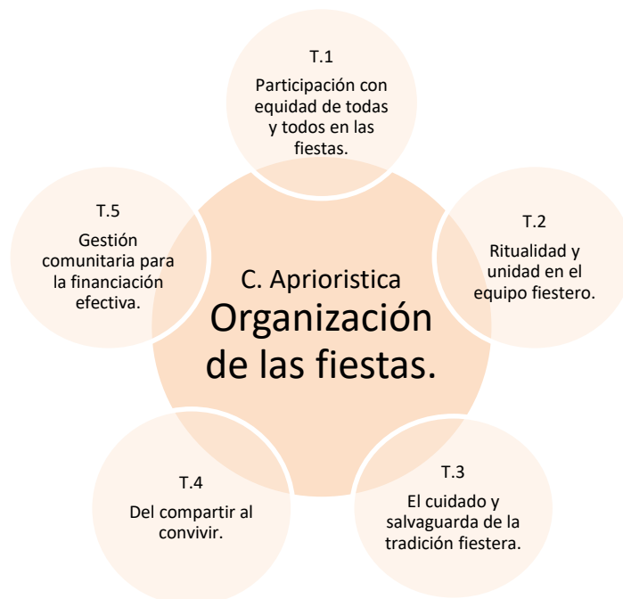
Ilustración 2. Categoría Organización de la fiesta.

Nota: Categoría central 2, y 5 tendencias (Elaborado por Zaraza, 2022 para este trabajo)