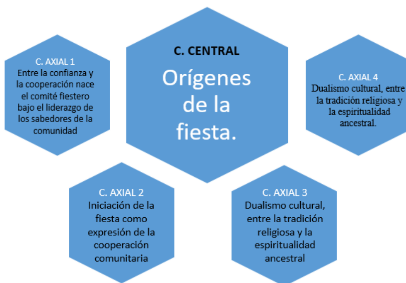
Ilustración 1. Categoría Orígenes de la fiesta.

En esta gráfica se visualiza la matriz sobre la categoría de análisis central; Los orígenes de las fiestas, de la cual emergen cuatro nuevas categorías axiales.