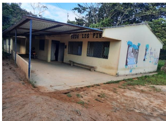
Figura 2. IE. El Carmen Institución Educativa El Carmen del Agrado Huila, Sede Los Pinos

La IE CAH, está situada en el extremo noroccidental del municipio del Agrado en los límites con el municipio de Paicol; a una distancia de 21 Km. de la cabecera municipal. Sus límites son: al Norte: vereda Los Pinos, al Oriente: Vereda La Ondina, al Sur: Vereda El Horizonte y al Occidente: Municipio de Paicol. El clima de la vereda es templado, de lluviosidad y vientos medios (Ver figura 2)