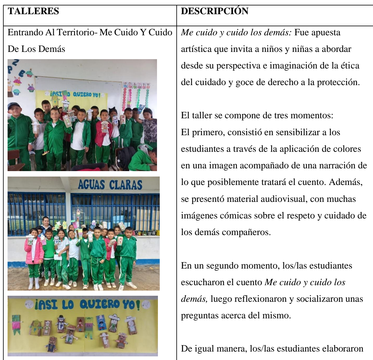
Tabla 1. Entrando al territorio- me cuido y cuido de los demás

Para este proceso de investigación se desarrollaron 2 talleres, el primero denominado ENTRANDO AL TERRITORIO- ME CUIDO Y CUIDO DE LOS DEMAS, en el cual se realizó el diagnóstico y la sensibilización, el cual permitió identificar los riesgos y oportunidades de transformación teniendo en cuenta las categoría de Ética del cuidado y entornos protectores, el segundo taller RULETA DEL CUIDADO en el cual se realiza la respectiva devolución de los hallazgos encontrados en el primer taller para continuar con el proceso.